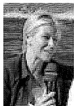
Donatella Bianchi La conduttrice della trasmissione Rai «Linea blu»